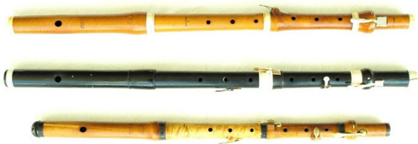
[Øverst] Skousboe, buksbom med elffenbenringe, to klapper. [I midten] Grenser, ibenholt med elffenbenringe, fire klapper (historisk reparation i hovedstykke og fodstykke). [Nederst] Hansen tertsflojte, buksbom med hornringe, fire klapper (nyt hjertesstykke samt nutidig reparation i hovedstykket)

ter på fløjte - og så har den i min optik det bedste fra både en piccolofløjte og en traversfløjte; det sprøde og det bløde forenet i én. Jeg er fuldstændig solgt, og kan kun udtrykke det på denne måde: Den mest charmerende klang, man kan forestille sig!