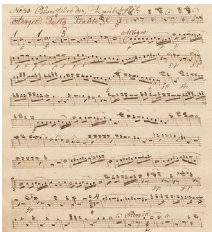
Uddrag fra ouverturen til Mozarts Trylleføjten. Som man kan se, er den for "Tert a Flauto".